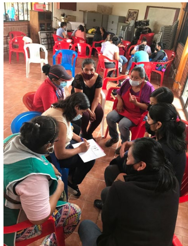
Taller Feminista a Mujeres

El resultado de estos encuentros fue importante por la participación de grupos y colectivos que trabajan en las comunidades, los procesos formativos en defensa del territorio, participación ciudadana, equidad de género, grupos de mujeres en ahorro solidario, etc. Se logró despertar un gran interés en la audiencia por debatir un enfoque -no tradicional- del feminismo europeo, académico. La narrativa del feminismo comunitario ha permitido resignificar los valores y la cosmovisión indígena de lo comunitario, encontrando similitudes con formas de organización ancestral, familiares y comunitarias. Al mismo tiempo, fue posible identificar que los procesos de discriminación, históricamente, no han sido iguales para todas las mujeres, sino que hay factores asociados a la raza, la clase social y la expresión de identidad sexo-genérica que han agravado los procesos de exclusión.